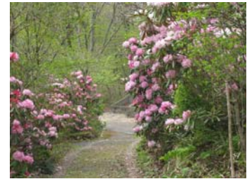
満開のアズマシャクナゲ