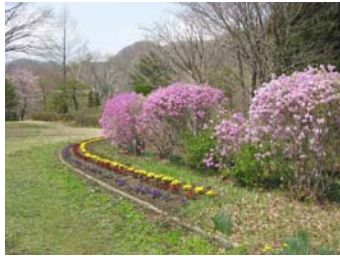
ツツジの咲く春の園内

他にも、炭焼き小屋やすだれ滝といった見所があり、遠足や校外学習の場としてご利用いただけます。なお、事前にご連絡いただければ、スタッフによるクイズラリーや炭焼きのご案内もいたします。