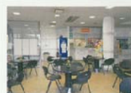
喫茶コーナーもあります (春から秋まで営業しています) 営業時間：10:30から6:30まで