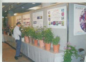
花の展示会・写真展 ミニコンサート

「都市緑化ホール」は多くの 人々に植物への興味や栽培 などの知識を深めてもらうための施設です。