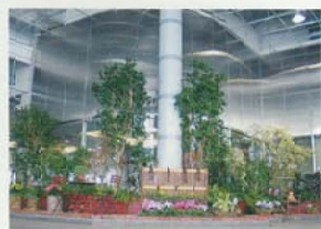
観葉植物の観賞、花のスケッチ