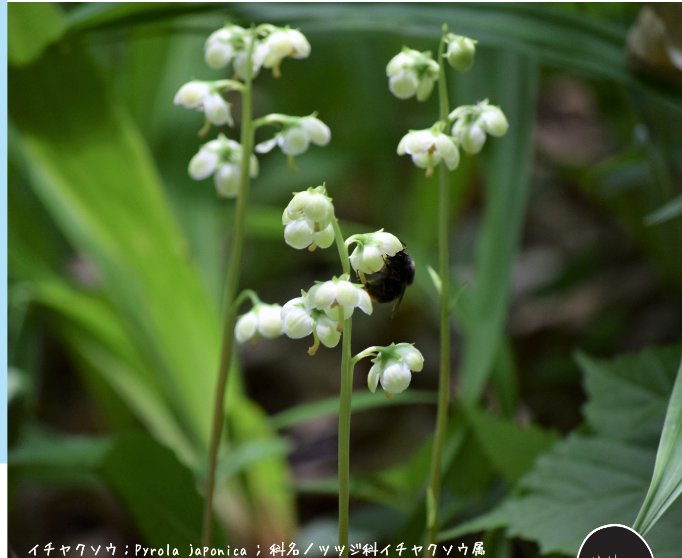
イチヤクソウ；Pyrola japonica；科名/ツツジ科イチヤクソウ属

「青葉の森緑地」は地下鉄青葉山駅から徒歩15分で豊かな自然を満喫できる里山で、気軽な散歩から山登り気分まで味わえる変化に富んだ総延長約10km・最大標高差140mの散策路が魅力です。管理センターにはレンジャー（自然解説員）が常駐しており、園内の自然情報の提供やトレッキング・自然観察会・クラフト教室などのイベントも開催しています。詳しくはブログをチェック！また、個人や団体への園内ガイド（要予約）も行っています。お気軽にご相談ください。