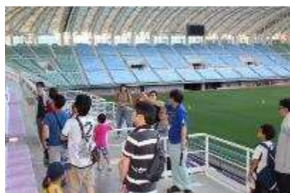
スタジアム見学会 見学者数 704人