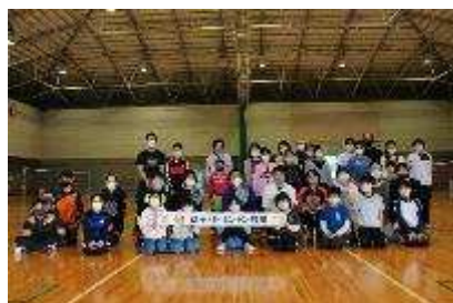
親子バドミントン教室 3月6日開催 34人参加