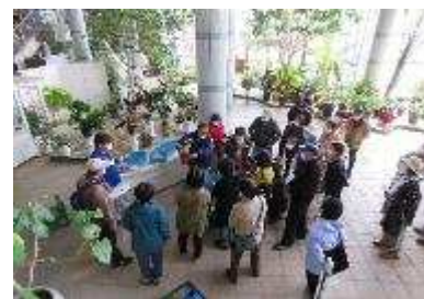
クリスマスローズの購入後の植え 替え実演 3月5日開催：50人参加