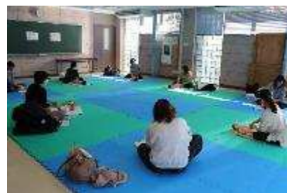
ベビーマッサージ教室 3月11日開催 14人参加