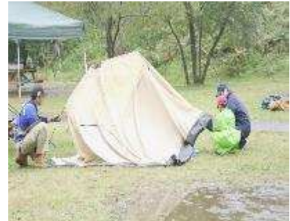
親子ビギナーアウトドア教室 10月12日 16人参加