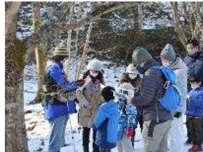
真冬の昆虫かんさつ会 1月23日開催 15人参加