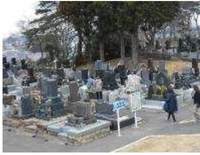
北山霊園 春彼岸の様子