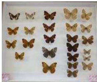
生き物紹介展示 標本（蝶）