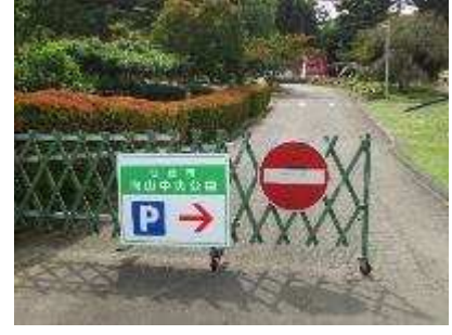
園内の環境整備 駐車場案内看板の更新設置