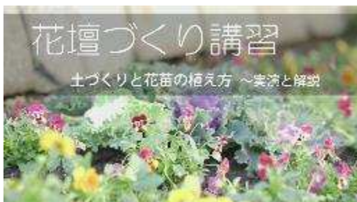
花壇づくり講習 協会 YouTube

令和 2 年度は、従来の実施方法を変更して花壇づくり講習の動画を制作し、市内の花壇団体約 280 団体に案内文書を送付しました。動画は協会 YouTube の限定公開とし、約 1 か月間公開しました。アクセス数は 150 件を超え、多くの団体に視聴していただきました。視聴した団体からのアンケート結果から「実演と解説がまとめられて分かりやすかった」との感想が寄せられ、満足度の高いことが伺えました。これまで花壇コンクール等に参加していなかった団体が HP や動画を視聴しており、裾野を広げる効果もありました。