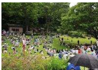
萩まつり 9月19日～10月1日開催 入園者 4,836人