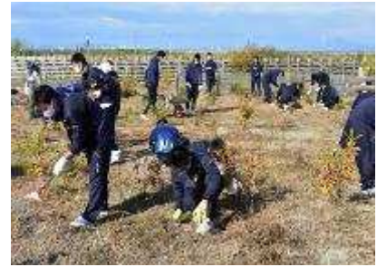
ふるさとの杜再生プロジェクト 育樹会(南官林地区) 11月7日開催 62人参加