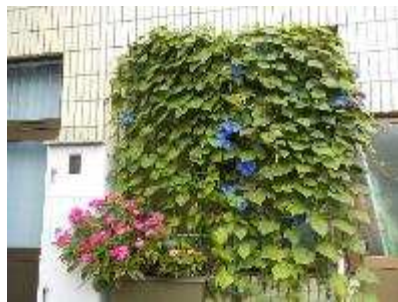
緑のカーテン整備事業 青葉山公園