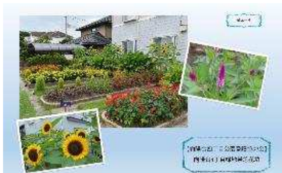
仙台市緑と花いっぱい花壇写真展