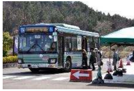
いずみ墓園 春彼岸の様子