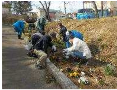
地域住民花壇作り事業 桜ヶ丘公園