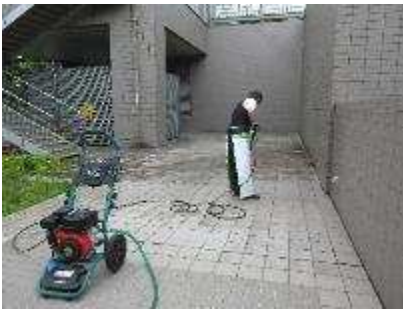
場内の環境整備 洗浄作業