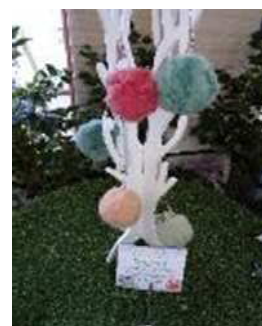
【キーパーズコレクション】