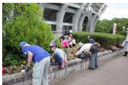
東側花壇ガールスカウト 共同植え付け作業 6月7日開催 20人参加