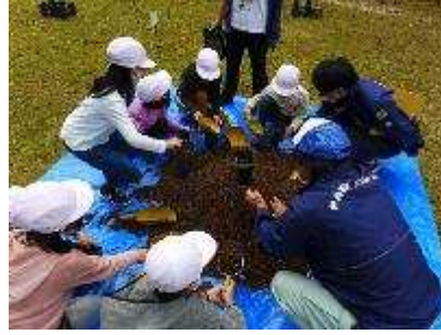
どングりの森づくりプロジェクト②