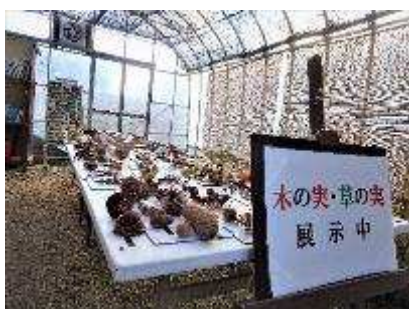
木の実・草の実展示 10月1日～11月30日開催