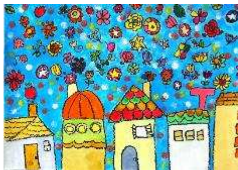
令和 2 年度緑と花いっぱい絵画コンクール