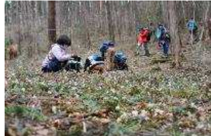
セリバオウレンのお花畑をみに行こう