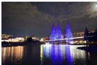
イルミネーション&キャンドルナイト、 泉ヶ池ブルーライトアップ 12月11日～25日開催：4,961人観覧