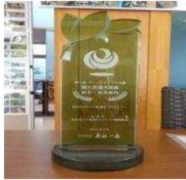
第1回グリーンインフラ大賞 国土交通大臣賞(防災・減災) 仙台ふるさとの杜再生プロジェクト