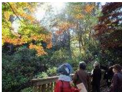
もみじ観賞会 11月14～15日開催 入園者 506人