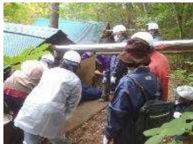
親子炭焼き体験教室 10月3日・4日・17日開催 11人参加