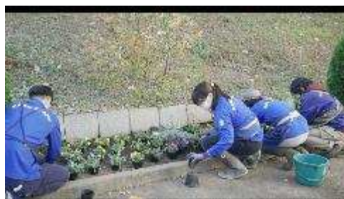
講習の様子（配信画像より）