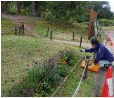
園内の環境整備 花壇の植栽作業