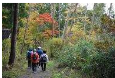
紅葉めぐりハイキング

市民への情報提供や、希少植物の保護保全に適した園内管理作業を行うため、巡回時に確認した植物、昆虫、鳥類を記録し、現在の生物の状況把握に努めました。