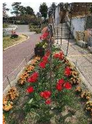
植栽管理 (アフリカ園中央園路)