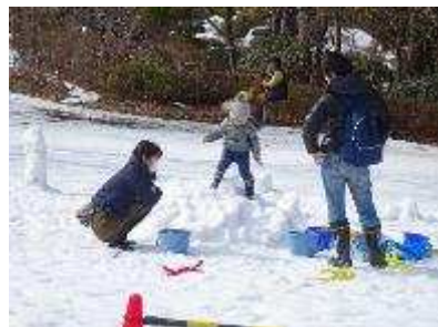
冬季特別開園 1月17日・2月14日・3月14日 入園者 256人