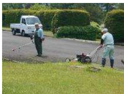
葛岡墓園 除草作業