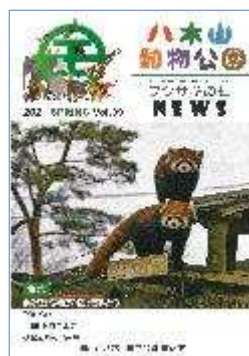
「八木山動物公園 NEWS」第 39 号