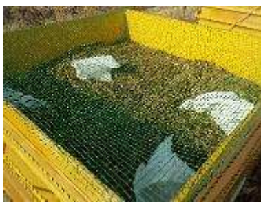
落ち葉のリサイクル事業① 海岸公園