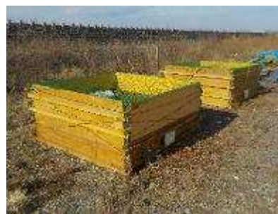
落ち葉のリサイクル事業② 海岸公園