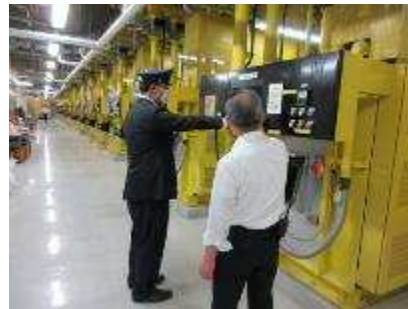
火葬炉研修 8 月 1 日～31 日実施 3 人参加