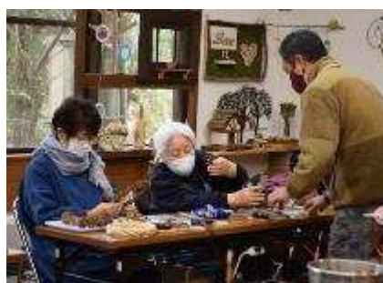
森の素材でリースづくり 12月12日開催 9人参加