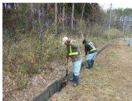
葛岡墓園 清掃作業