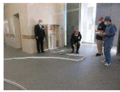
屋内消火栓取扱訓練 3 月 6 日・7 日実施 17 人参加