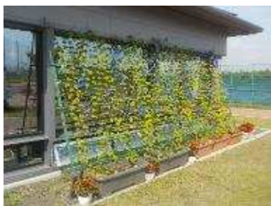
緑のカーテン事業 海岸公園