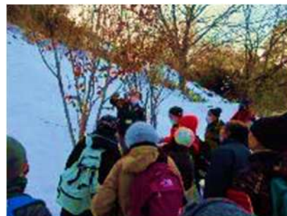
冬の野草園自然ウォッチング 1月10日開催 20人参加