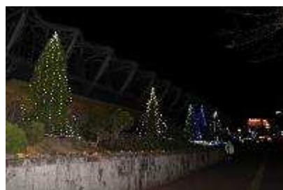
スタジアム東側イルミネーション 12月11日～25日開催