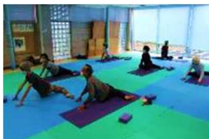
ストレッチ教室 11月8日開催 5人参加