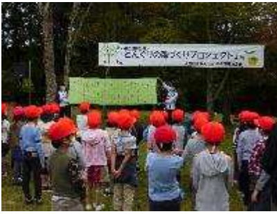
どングりの森づくりプロジェクト① 10月22日開催 108人参加