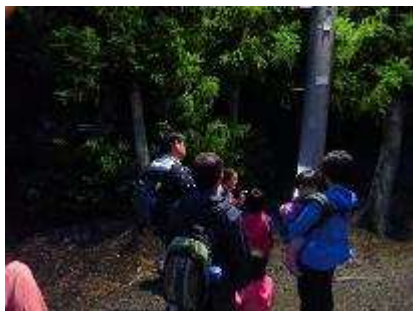
夜の森のかんさつ会 6月27日開催 9人参加

『森のおくりもの』第 343 号～第 354 号の発行や YouTube 動画を配信し、自然観察の森の生き物等の情報を発信しました。