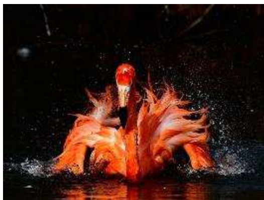
令和2年度（第32回）動物写真コンクール 市長賞受賞作品