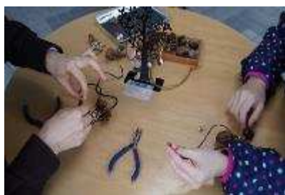
クラフトカフェ「木の実リース」 11月8日開催：24人参加