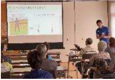
初心者パークゴルフ教室 9月29日開催 22人参加