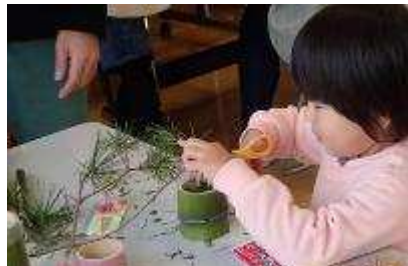
親子で作るミニ門松