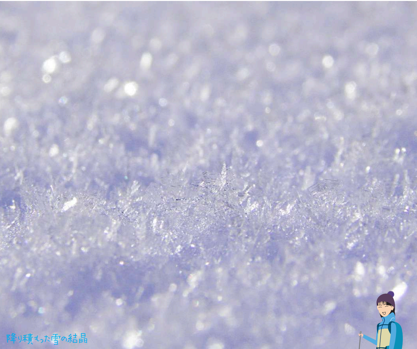
降り積もった雪の結晶

『青葉の森緑地』は地下鉄青葉山駅から徒歩15分で豊かな自然を満喫できる里山で、気軽な散歩から山登り気分まで味わえる変化に富んだ総延長約10km・最大標高差140mの散策路が魅力です。管理センターにはレンジャー（自然解説員）が常駐しており、園内の自然情報の提供やトレッキング・自然観察会・クラフト教室などのイベントも開催しています。詳しくはブログをチェック！また、個人や団体への個別の園内ガイド（要予約）も行っています。お気軽にお問合せください。