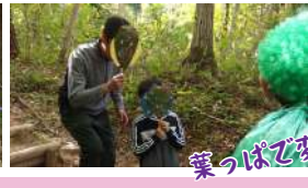
クワでの葉くぐり