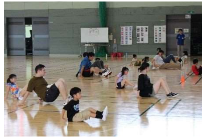
親子で遊ぼう 5月14日ほか3回開催 36組81人参加