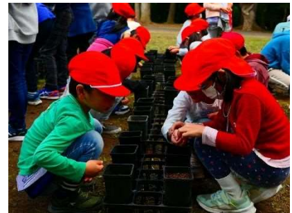
どんぐりの森づくりプロジェクト 植え付け作業の様子