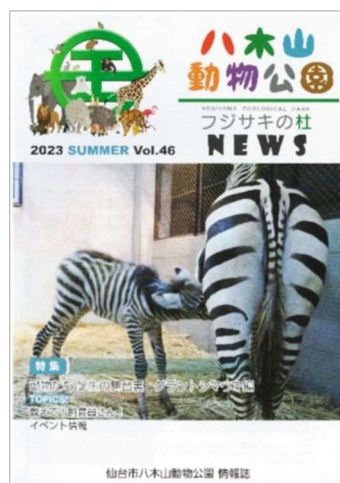
「八木山動物公園NEWS」第 46 号