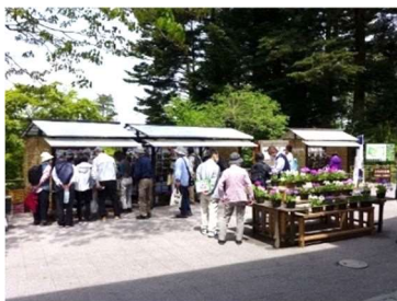
さくらそう展 4月23日～5月7日開催 期間入園者数 3,957人

フェアの本会場に作られた花壇とは違って野生の草花が自然に近い状態で生育する姿を楽しんでいただきました。さくらそう展や植物画の展示会など様々な企画で、春らしい華やかさで入園者を迎え、それに加えて野草園の歴史に関する展示会なども興味深く楽しんでいただきました。