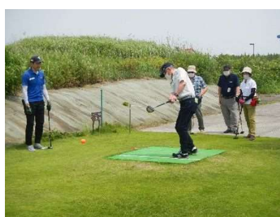
初心者パークゴルフ教室