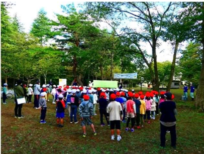
どんぐりの森づくりプロジェクト 10月12日開催 97人参加

10月12日に向山小学校1・2年生と一緒にどんぐりの植え付けを行いました。また、海岸公園での育樹会等に提供するため、どんぐりの苗を栽培しました。