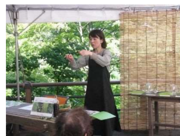
野草みちくさ喫茶 6月17日開催 15人参加