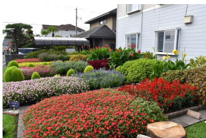
緑と花いっぱい花壇コンクール 最優秀賞 地域の部

9 月に審査を行い、市長賞ほか 12 賞及び佳作の全 92 作品の入選が決定し、11 月 5 日に表彰式を行いました。