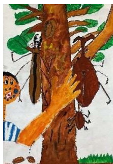
緑と花いっぱい絵画コンクール 仙台市長賞 小学校低学年の部