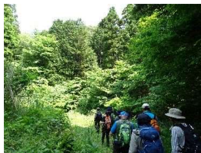
初夏の鉤取山ネイチャーウォーキング