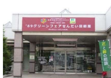
'89 グリーンフェアせんだい回顧展