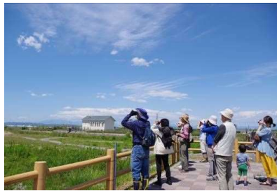
初夏の荒浜を歩こう 4月30日ほか2回開催 25人参加