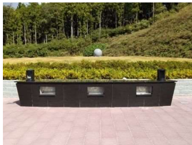
合葬式墓所 いずみ墓園