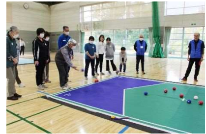
ボッチャ体験教室 11月19日開催 12組29人参加