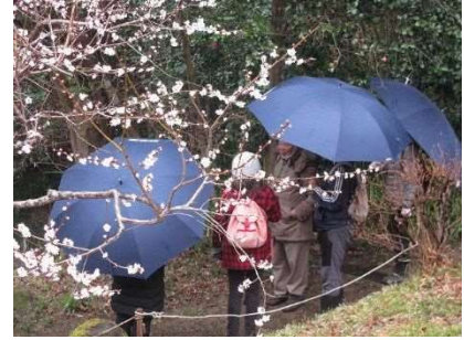
開園観察会「早春の野草園を歩こう」