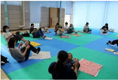
ベビーマッサージ教室 4月13日ほか11回開催 115組230人参加