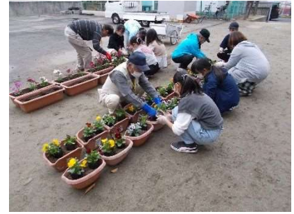
仙台市立西中田小学校との 協働花植え