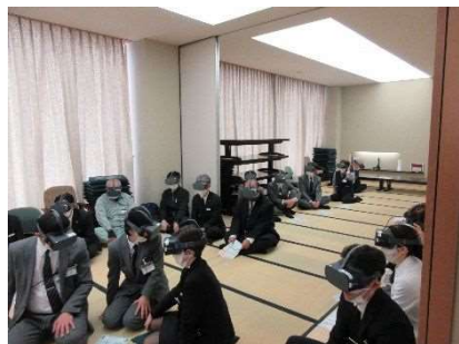
消防訓練（VR地震体験） 6月5・12日、3月6日実施 延べ61人参加