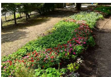
緑と花いっぱい花壇コンクール 最優秀賞 学校の部