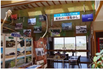
荒浜のいまむかし 4月26日～6月18日開催

初めて東部エリア（荒浜地区）を訪れた方や東日本大震災後久しぶりに訪れた方が、各種イベントを通じて、震災の復興状況や荒浜の自然を感じていただくことができました。