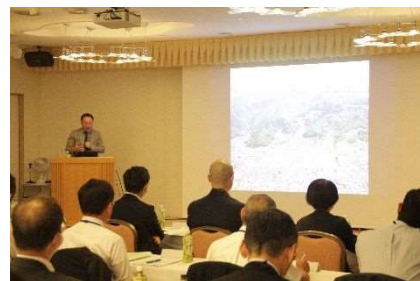
全国公園協会協議会総会 講演会の様子 6 月 8 日～9 日開催