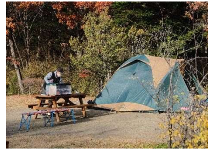
チャレンジ!冬キャンプ 11月25日・26日開催 8人参加