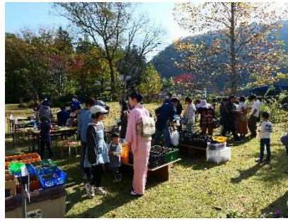
あったか・ほっこり秋保大滝植物園まつり 11月3日開催 1,512人参加