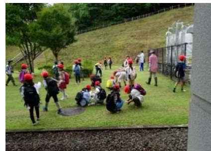
自然観察会 7月12日開催 28人参加 いずみ墓園