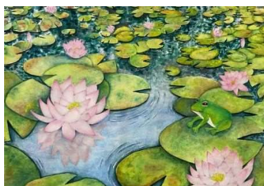
緑と花いっぱい絵画コンクール 仙台市長賞 小学校高学年の部