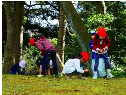
どんぐりの森づくりプロジェクト どんぐりを拾う様子