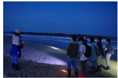
夜のスナガニ観察会 6月17日開催 16人参加