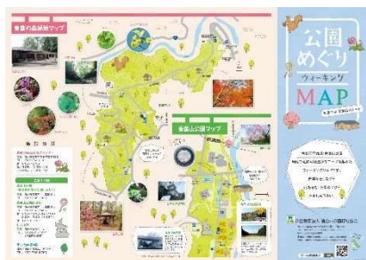
公園めぐりウォーキング MAP 青葉の森・青葉山公園スタート版 (表面)