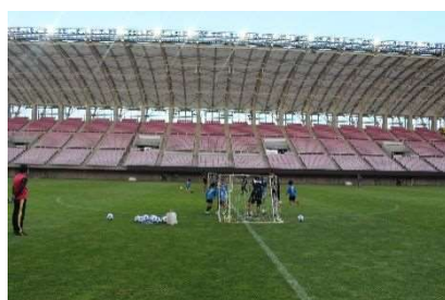
夜のピッチで遊んでみよう