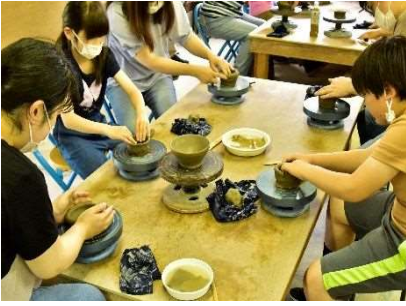
陶芸「ろくろで作る堤焼」 6月24日開催 22人参加