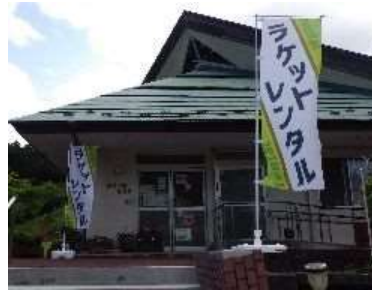
ラケットのレンタル事業 湯元公園