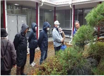
樹木剪定講習会 中田中央公園