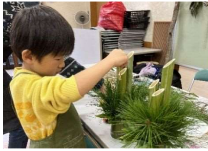
親子で作るミニ門松 12月23日開催 24人参加