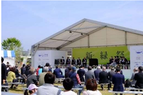
新緑祭 ステージの様子