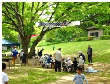
野草園こどもの日 5月5日開催 入園者数 604人