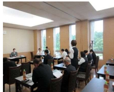
葬祭業者との意見交換会 9月4日 延べ26人参加