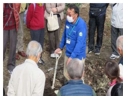
野菜の土づくり 12月10日開催：29人参加