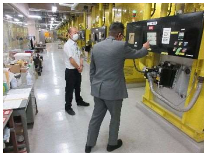
火葬炉運転研修 7月2日ほか18回実施 延べ25人参加