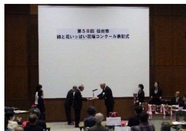
緑と花いっぱい花壇コンクール 表彰式 11 月 20 日