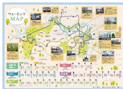
公園めぐりウォーキング MAP 青葉の森・青葉山公園スタート版 (裏面)