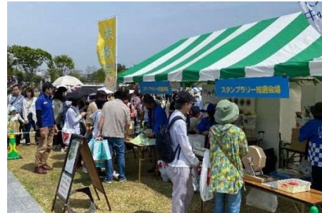
新緑祭 イベントブースの様子