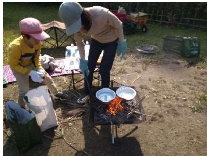
親子でのんびり観察会& かんたんサバイバル 10月28日開催 18人参加