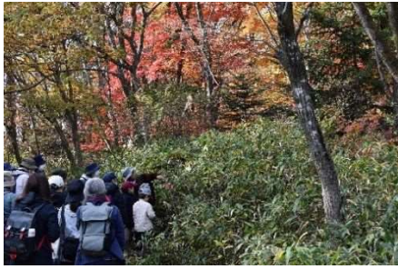
癒しの晩秋の森ガイドウォーク 11月23日開催 16人参加