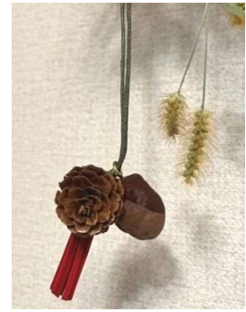
ブログ読者プレゼント 木の実ストラップ