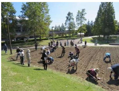
アイスガーデンにネモフィラをまこう 10月14日開催：41人参加【新規】