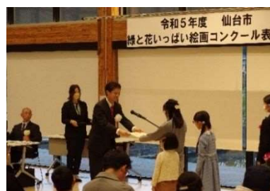
緑と花いっぱい絵画コンクール 表彰式 11 月 5 日