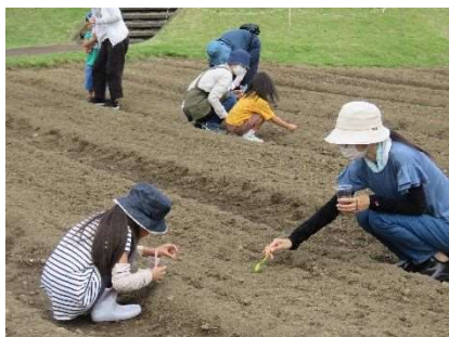
親子で種まき全員集合！ 6月24日開催：22人参加