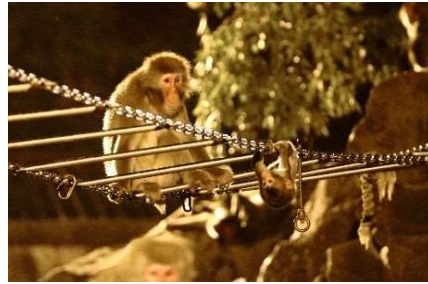
第 35 回 動物写真コンクール 仙台市公園緑地協会理事長賞