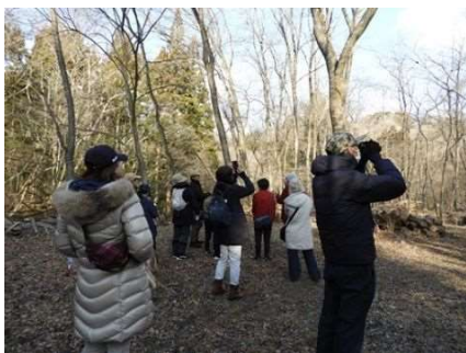
おはよう野鳥かんさつ