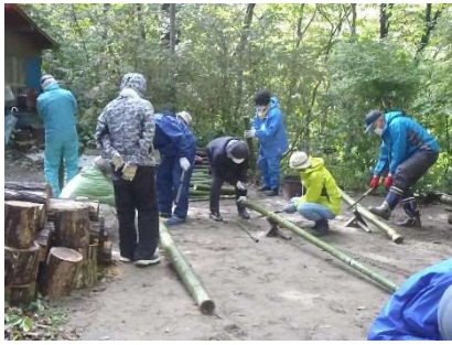
秋保炭焼き伝承・体験会 10月7日・8日・21日全3回 延べ28人参加