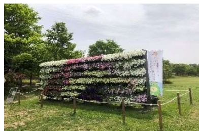
杜のウォールガーデンプロジェクト