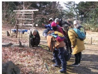
早春の自然ウォッチング