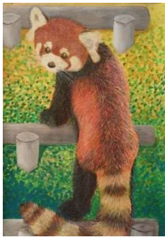
第 57 回 動物写生大会 中学校 3 年生