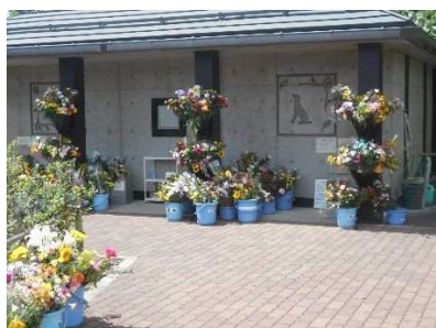
愛玩動物ペット納骨堂 葛岡墓園

地域小学生の環境学習の支援を行うことを目的とし、仙台市立根白石小学校3年生を対象に、園内（墓域外）の緑地をフィールドとした自然観察会を実施しました。