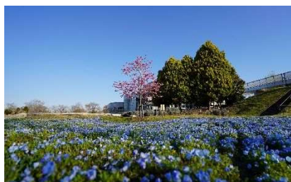
アイスガーデンプロジェクト

4 月 26 日～6 月 18 日の期間中 21 日間開催：相談件数 501 件