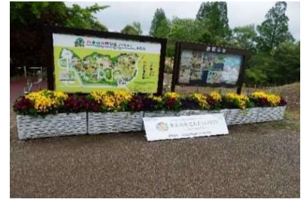
ビジターセンター前植栽 (樹木管理業務)