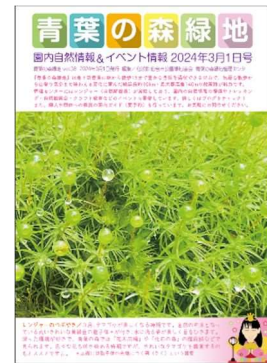
情報誌 青葉の森緑地 第38号