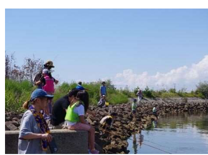
貞山運河ハゼ釣り体験