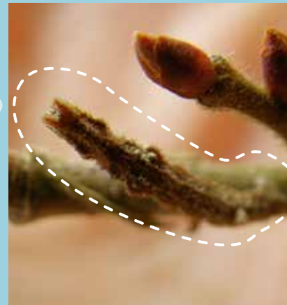
キマエエダシャクの幼虫越冬 枝に擬態しています