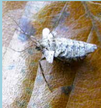
クロスジフユエダシャク/成虫越冬。♀は翅が退化しています