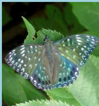
スミナガシ/左：木の枝などにぶら下がってサナギで越冬します 右：水面に墨汁を流したような模様の成虫です