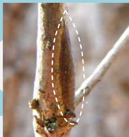
コミミズク/枝にぴったりはりついて幼虫で越冬します