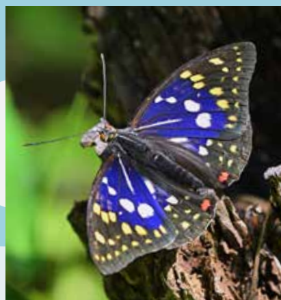
オオムラサキ/左：幼虫の全身です。顔を葉面につけています（表紙） 右：成虫です。日本の国蝶です