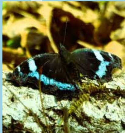
ルリタテハ/左：成虫で木の幹の翅を閉じて越冬します 右：春に翅を開いて日向ぼっこするようす