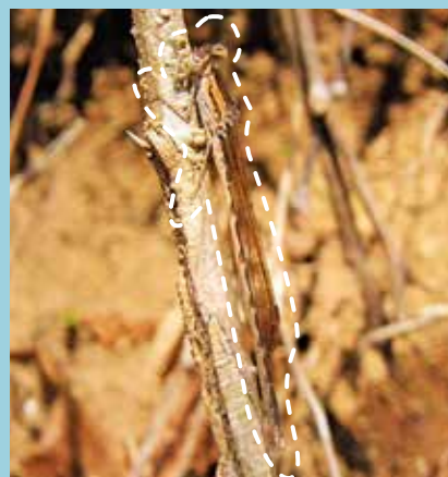
オツネトンボ/数少ない成虫越冬するトンボです