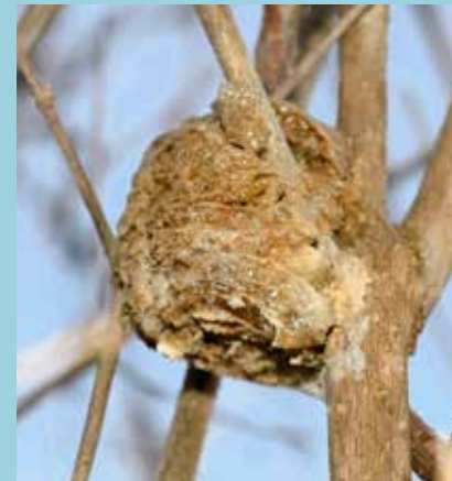
オオカマキリは卵で越冬。小さいカマキリがいっぱい出てきます