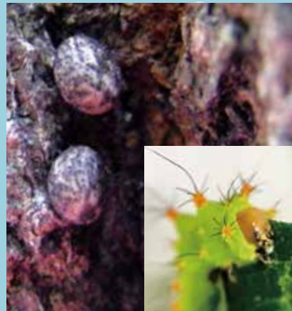
ヤママユガ/卵で越冬します 右下は葉を食べる幼虫です