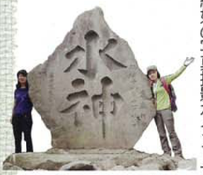
高さ2m50cmもある水神碑。七北田川流域の人々が村単位で来て山頂で雨乞いしていたが、登頂が大変なため、この場所に石碑を建てて雨乞いしたと云われている。

メンバーは6名、登山経験者は1名後は初心者ばかり。スキー場下の大きな駐車場からスタート。途中で「泉岳少年自然の家」を通過する。ここでガイドマップや登山情報を入手することも可能だ。 水神入口の看板を過ぎ、徐々に山道らしくなっていく。途中で水神平の看板があり、他のコースへの分岐点となっている。左には、七北田川の源流の一つ、樋沢(ヒサ)川が流れ、紅葉と清流を楽しみながら歩いた。スタートしてから一時間ほどで水神碑に到着。この大きな碑は明治28年に雨乞いのために建てられたものである。これを麓から運んできた労力は相当なものだったろうと想像される。現在の私たちにとっては登山ルートの大切な標識として、また絶好の写真撮影ポイントでもある。