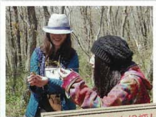
森の女子会は大好評!

4月28日みどりの日に、青葉の森緑地で女性レンジャーが企画した初の「森の女子会」を開催しました。春の花や若葉の感触を楽しんだり、動き始めた昆虫などのいきものを観察しながら、ゆったりとした時間を過ごしたようです。次回は参加した皆さまの「森でこんなことやってみよう!」を参考に、紅葉も楽しめる会を11月18日(日)に開催します。お楽しみに!