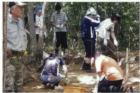
東北福祉大梶原研究室による発掘調査

昨年、遊びと学びの拠点となるツリーハウスが完成し、里山を活かした豊かなコミュニティ作りが期待されます。