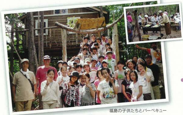
福島の子供たちとバーベキュー

東日本大震災後は、福島に住む子供たちを蒲沢山に案内し、登山やバーベキューを楽しんでもらうなど支援活動も行っています。ツリーハウスのそばでは蒲沢山遺跡(縄文時代)の発掘調査が行われており、歴史景観としても活用していきたいです。