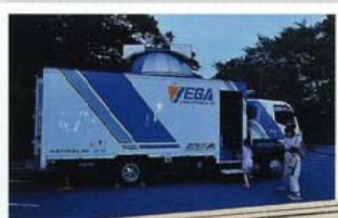
移動天文台車「ベガ号」

7月16日、野草園で天文台とのコラボイベント「星空を楽しむ会」を開催しました。街中にありながら、住宅の照明等に影響されない野草園は夏の夜空を楽しむにはもってこいのフィールド。当日は、天文台学芸員による星の解説や移動天文台車「ベガ号」による天体観測のほか、野草園職員による星型に見える花の解説も行われ、星空が満喫できた一夜でした。