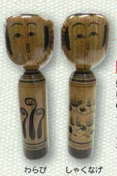
わらび しやくなげ

建物の木材全てが定義の杉を使い旅館として営まれていた。歴史ある建物とあってとても風情のあるお店だ。各種そば・うどんの他に、わらび餅など「甘味」も多くあるのが魅力的。