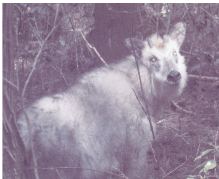
カモシカのタイコ