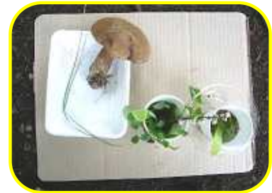
カップケーキとわかめのスープ きのこことともに