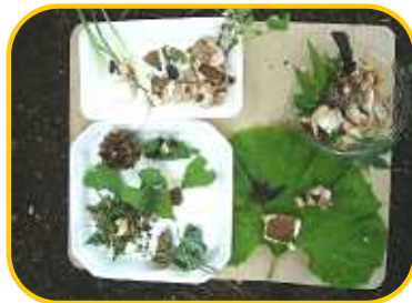
ハッピー Spoon きのこハンバーグ みんなでたべよスープ にじいろちゃん、リボンちゃん カントシット、きのこ花