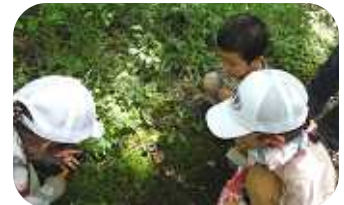
コケを取りに来たけれど、やっぱりキノコが気になる…。