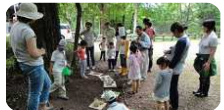
森の神さまありがとうございました