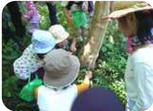
別名『死人の指』といわれる黒いキノコに興味津々。