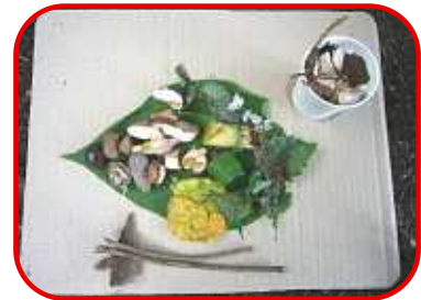
きのこのこびとのお誕生日