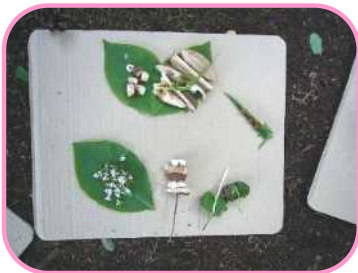
やきとり ～ご飯にお花をちらしました～