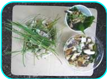
もりのひえひえらーめん はちみついるのきのこすーぷ まるまるもりもり もりはるまき