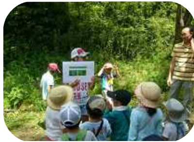
鈴木ひかりさん カタバミで 10 円玉をみかくとピカピカになるのはどうして？