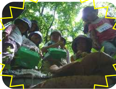
うわぁ 大きいキノコ!!