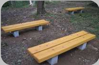
花木広場の新しいベンチ

園内の各所で工事が進められており、これまでに花木広場の老朽化したベンチの交換や、花木広場と化石の森を結ぶ道の木道設置などが行われました。作業は10月中続く予定です。作業により、多少のご不便をお掛けすることがあるかもしれません。何卒ご協力をお