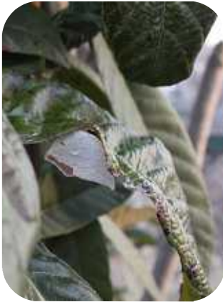
何処かわかりますか?

まだ、朝の最低気温が氷点下の寒い3月上旬、常緑の葉っぱの下の白いものにふと目に止まりました。