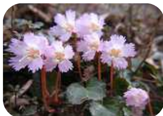
「イワウチワ」青葉の森の名品です。場所：森の花園