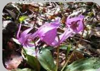
「カタクリ」三居沢は例年3月末に咲き出します