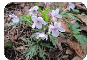
「エイザンスミレ」葉に切れ込みのあるスミレです 場所：せせらぎ広場

この他にもたくさんの花が咲く春は青葉の森のベストシーズンです。ぜひお越しください