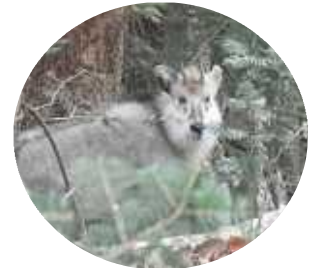
カモシカが出てきました

この冬は雪が多かったため、まだ雪に覆われているところが多く、この日は残念ながらクロサンショウウオに会うことができませんでした。でも、カモシカに会えたのでラッキーと思って、もう少ししてから、再チャレンジしてみようと思います。