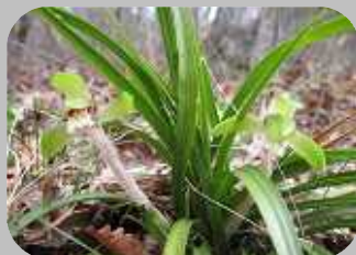
「シュンラン」今年中央入口が多く見れそう