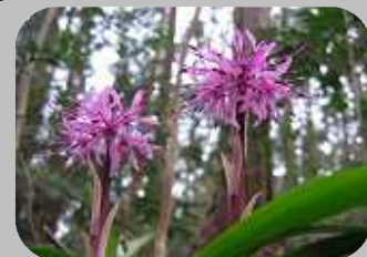
「ショウジョウバカマ」群生した斜面は見ごたえあり