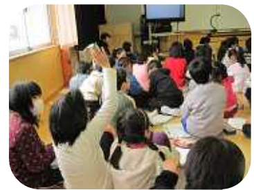
活発な意見交換の

みんなこの1年間に学んだことを来年度の1年生に教える計画だそうです。立派な発表でしたから、きっとうまくいくと思います。