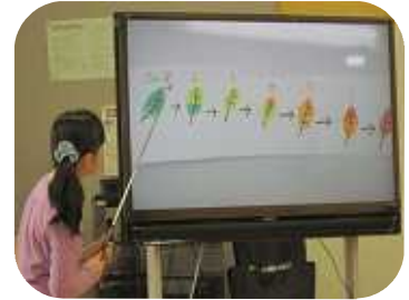
紅葉のしくみにつ

私達との公園探検では体験が中心になるので、図鑑に載っている内容を解説したり、一緒に確認するといった時間は少なくなりますが、発表内容をまとめる過程で、改めていろいろなことを確認し理解したことが伝わってきました。