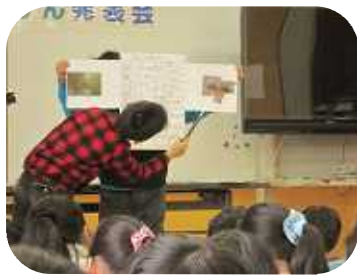
クモと昆虫の違いをわかりやすく表にした

みんなの発表内容は、一緒に行った授業の枠を超えて、自分の興味のあることを追求したものでした。