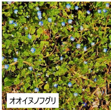
オオイスノフグリ

3月はまだまだ花の種類は少ないですが・・・ 足元をよく見てみると、小さな花がたくさん咲いています。 森の中を散策するときは、街を歩くときよりもゆっくりとしたリズム で歩いて色とりどりの春を感じてみてください。