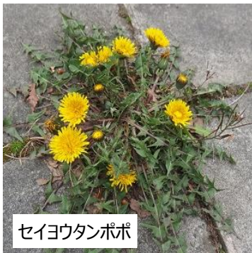
セイヨウタンポポ