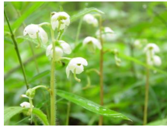
イチヤクソウ(一葉草)

菌に出会って栄養をもらわないと発芽できない、葉緑素をもたない植物。花粉はマルハナバチに運んでもらい、種はゴキブリに運んでもらいます。