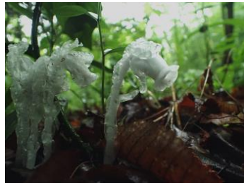
ギンリョウソウ(銀竜草)

一斉に白い花を咲かせる様子はまさに「スノーベル(英名)」。よい香りがして、コマルハナバチなどがたくさんやってきて受粉してくれます。