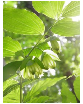
ワニグチソウ(鰐口草)

めしべが花からはみ出すほど長いのが特徴。土の中では根っこが菌とつながっていて、菌から栄養をもらって生きています。