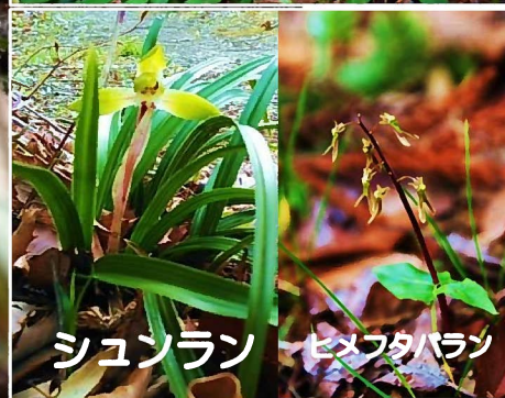
シュンラン ヒメフタバラン