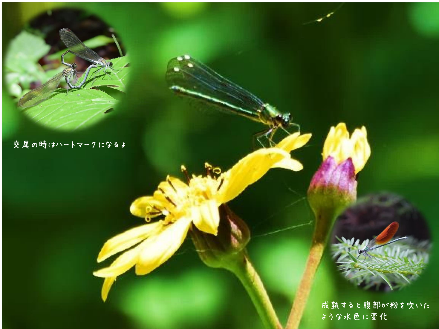
交尾の時はハートマークになるよ