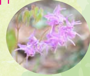
イカリソウ (全域・特に花木広場)

ピークは終わりましたが、まだ 残っているものがあるかも？ 夕木(4月号参照)をアリが運ぶ のを観察して見るのも面白いです