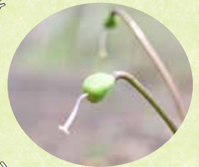
カタクリの実 (全域)

ピークは終わりましたが、まだ 残っているものがあるかも？ 夕木(4月号参照)をアリが運ぶ のを観察して見るのも面白いです