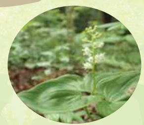
マイヅルソウ (全域)

小さな白い花を房状につ けるので、花が咲くとま るでガラスのように見え ます。マンニンの香がほ のかにします