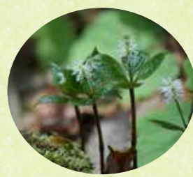
ヒトリシズカ (中央散策路)