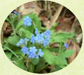
ルリソウ (せせらぎ広場) 名前のように清楚な瑠璃色(紫がかったものも あります)で1cmにも満たない小さくて 可愛い花です