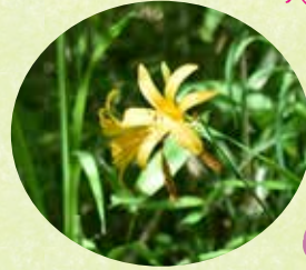
ゼンテイカ (化石のみち・ モミジのみち) 別名ニッコウキスゲ