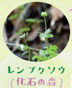
レンパクソウ (化石の森)