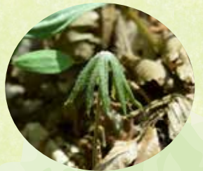
ヤブレガサ (中央散策路)