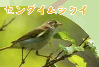
センダイムシクイ