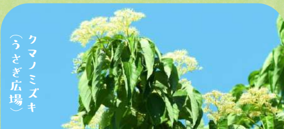
クマノミズキ (うさぎ広場)