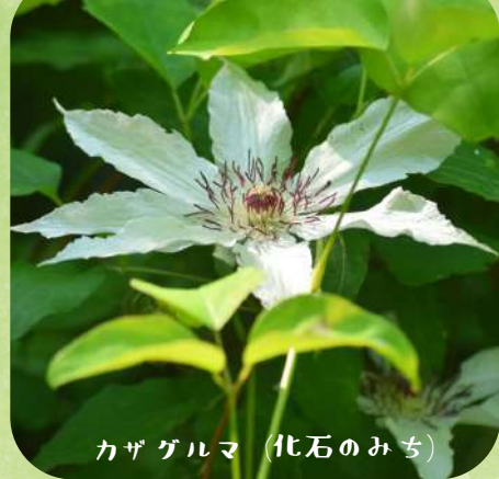
カザグルマ (化石のみち)