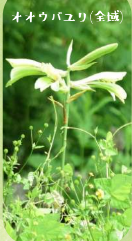
オオウバユリ(全域)