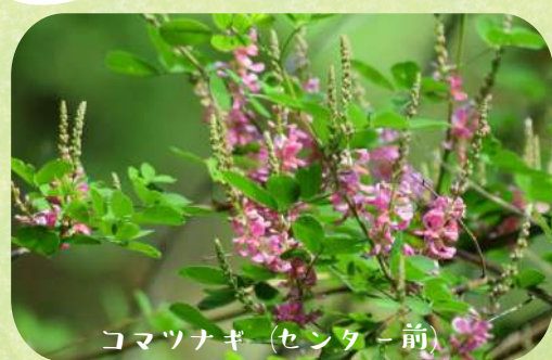
コマツナギ (センター前)