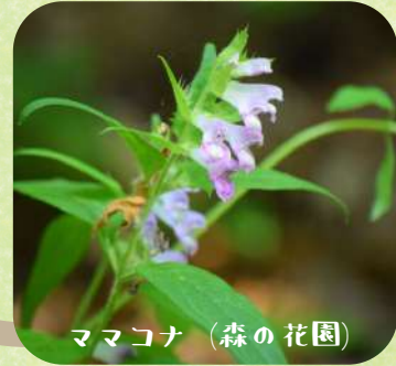
ママコナ (森の花園)