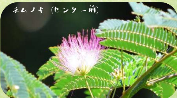
ネムノキ (センター前)