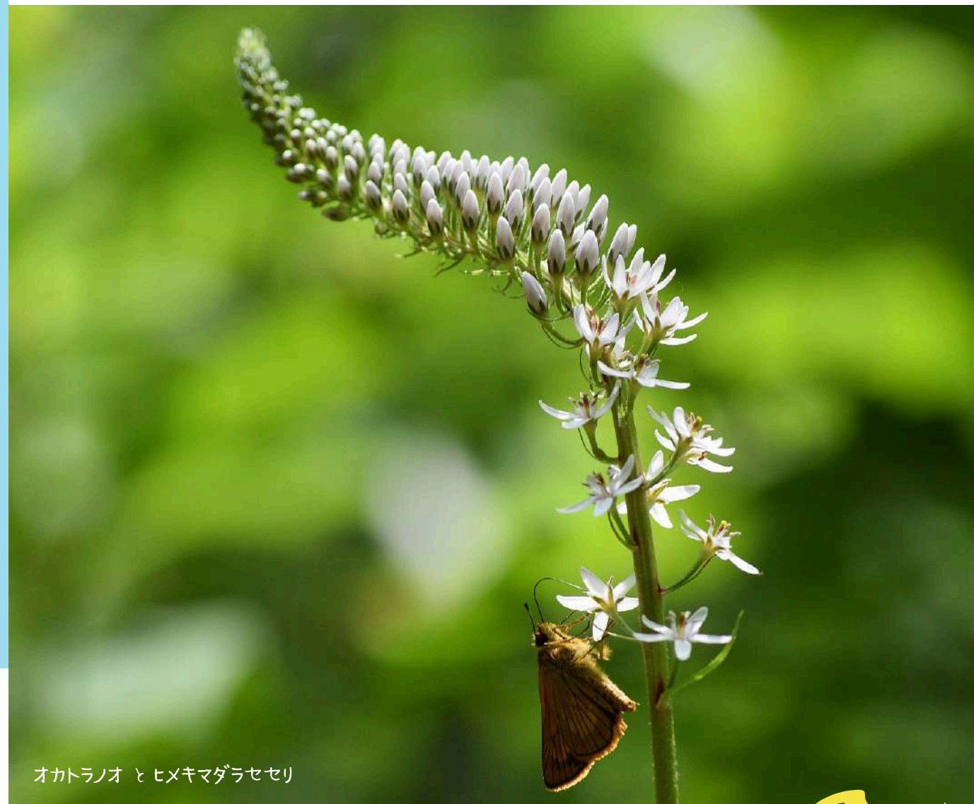
オカトラノオ と ヒメキマダラセセリ

『青葉の森緑地』は地下鉄青葉山駅から徒歩15分で豊かな自然を満喫できる里山で、気軽な散歩から山登り気分まで味わえる変化に富んだ総延長約10km・最大標高差140mの散策路が魅力です。管理センターにはレンジャー(自然解説員)が常駐しており、園内の自然情報の提供やトレッキング・自然観察会・クラフト教室などのイベントも開催しています。詳しくはブログをチェック! また、個人や団体への個別の園内ガイド(要予約)も行っています。お気軽にお問い合わせください。