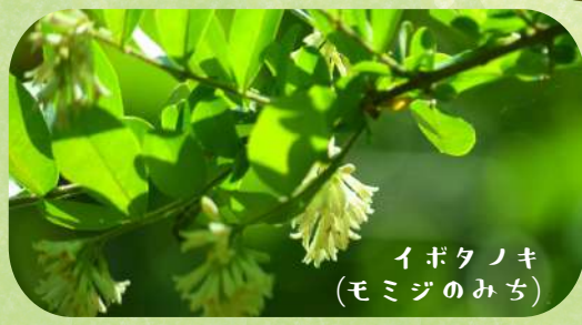
イボタノキ (モミジのみち)