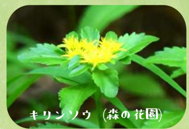
キリンソウ (森の花園)