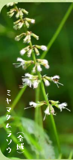
ミヤマタムラソウ (全域)