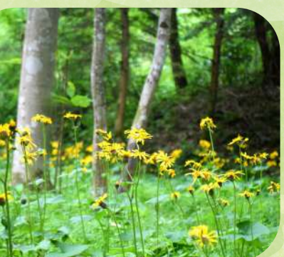
マルバダケブキ (せせらぎ広場)