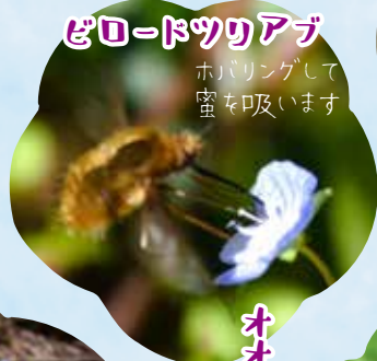
ビロートツリアザ ホバリングして蜜を吸います