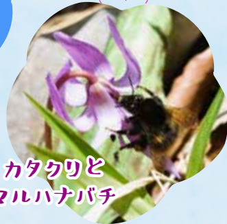
カタクリとマルハナバチ