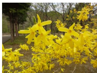
チョウセンレンギョウ【朝鮮連翹】 品種 花：4月～5月 雌雄異株。葉より早く開花する