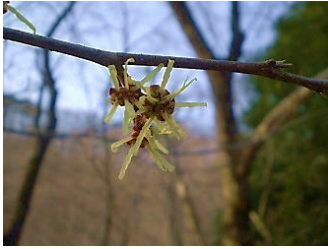
マルバマンサク【丸葉満作】 花：3月 雪融け前に開花。園内の野生のマンサクはマルバマンサク

園内に咲く四季折々の花や色とりどりの実、季節を告げる生きものなどの自然の情報を季節をおってお届けします