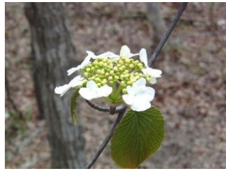
ムシカリ【虫狩】(オオカメノキ) 花：4月 園内の自然林に多くみられる