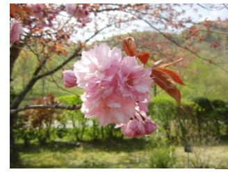
サトザクラ【里桜】(ヤエザクラ) 品種 花：5月 人為的な交配などによりできた園芸品