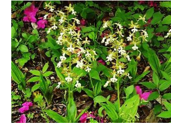
エビネ【海老根】 花：5月 野生のものは激減している 園内山野草園内にあり