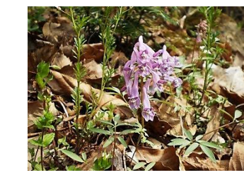
ヤマエンゴサク【山延胡索】 花：5月 群れて生える