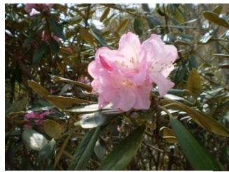
アズマシャクナゲ【東石楠花】 花：4月下～5月上 当園のメインの花。ウラジロともよばれる