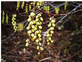
キブシ【木五倍子】 花：4月～5月 雌雄異株 園内北遊歩道にあり