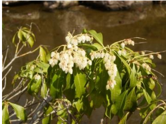
アセビ【馬酔木】 品種 花：4月～5月 万葉植物のひとつ。有毒植物