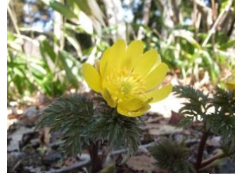
フクジュソウ【福寿草】 花：3月～4月 秋保でも自生地がわずかに残るのみ