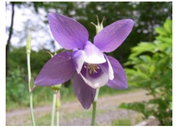
オダマキ【苧環】 品種 花：5月 花の形が麻糸を巻いた道具(苧環)に似ている