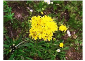
キバナコウリントンポポ【黄花紅輪蒲公英】 帰化 花：5月 全体に毛が密生