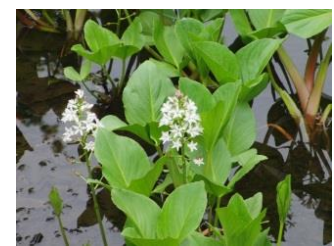
ミツガシワ【三楠】 花：5月 園内の池に咲く