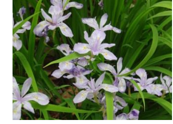
ヒメシャガ【姫射干】 花：5月 やや乾いた林下を好む