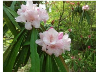
ホソバシャクナゲ【細葉石楠花】 花：5月上～中 他のシャクナゲより葉が細い