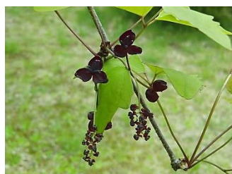
ミツバアケビ【三葉木通】 花：4月～5月 園内のアケビの種類では一番多い