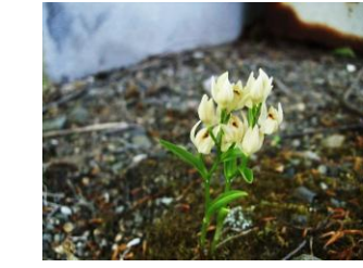
ユウシュンラン【祐舜蘭】 花：5月 ギンランの変種 高さ10～15cm 葉も退化し小さい。絶滅危惧種