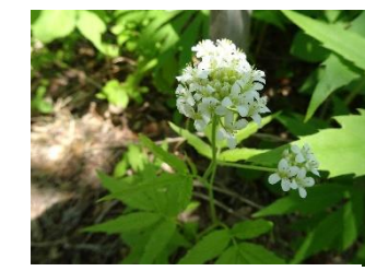
コンロンソウ【崑崙草】 花：5月 セリの花に似ている が十文字の白い花が特徴