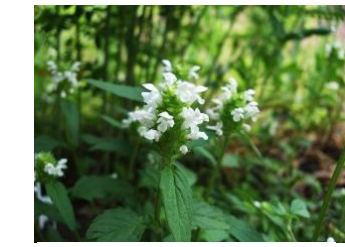
シロバナセイヨウウツボグサ 帰化 花：5月～6月 白い花を咲かせる