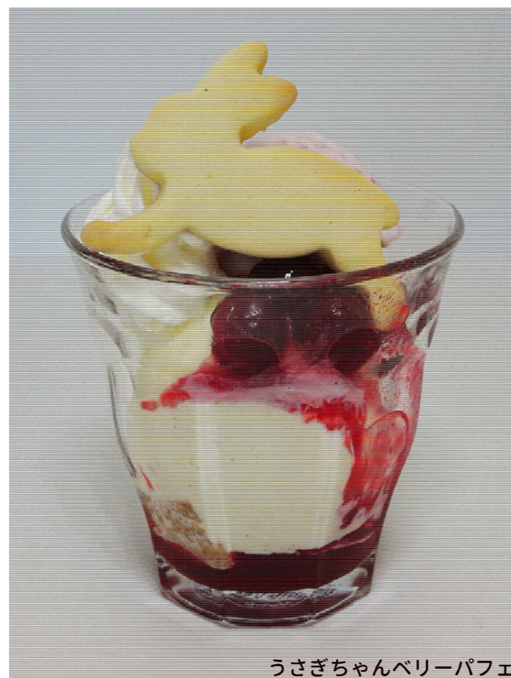
うさぎちゃんベリーパフェ