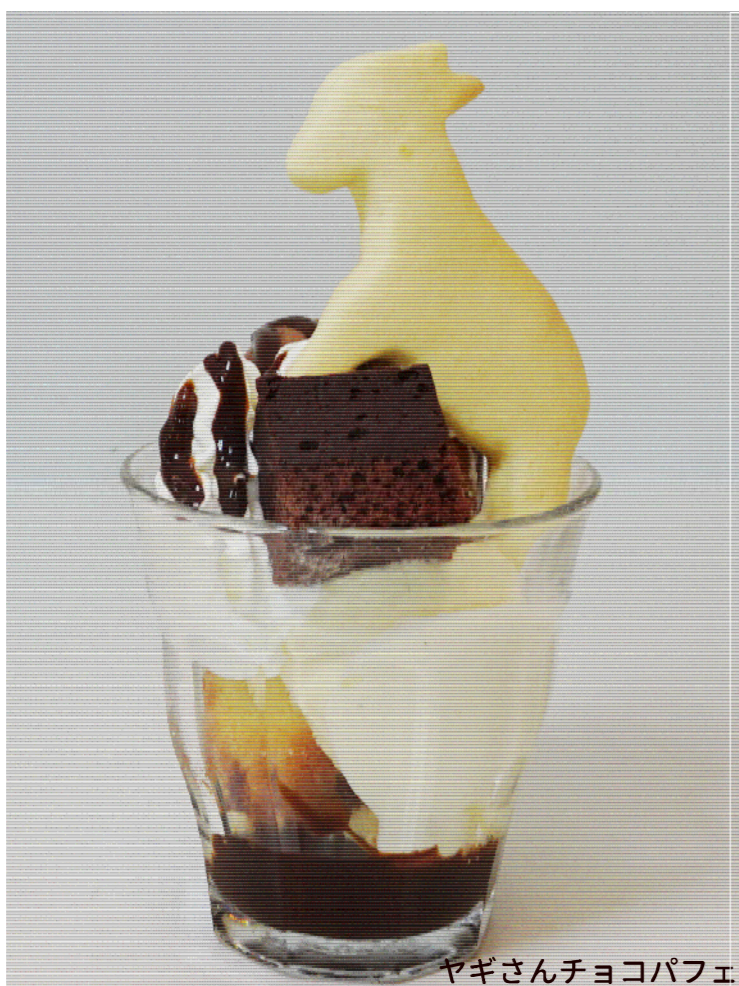
やぎさんチョコパフェ