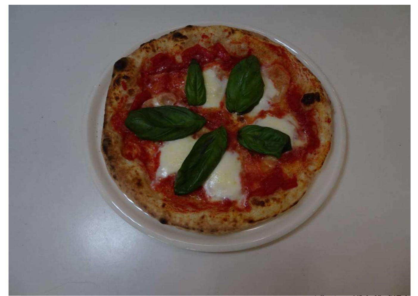
マルゲリータピザ