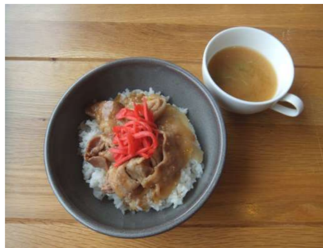
豚しょうが焼きボウル