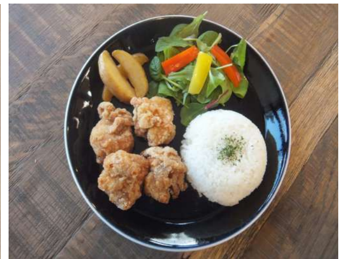
鶏の唐揚げランチ