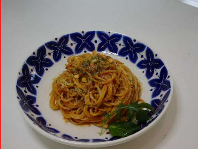
ボロネーゼパスタ