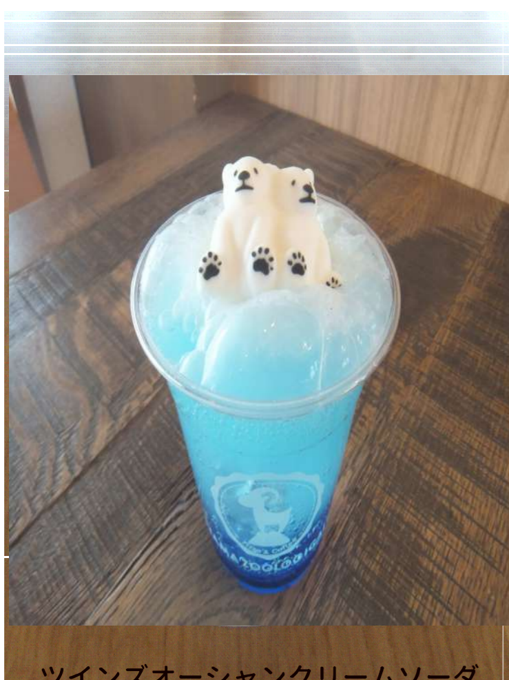
ツインズオーシャンクリームソーダ