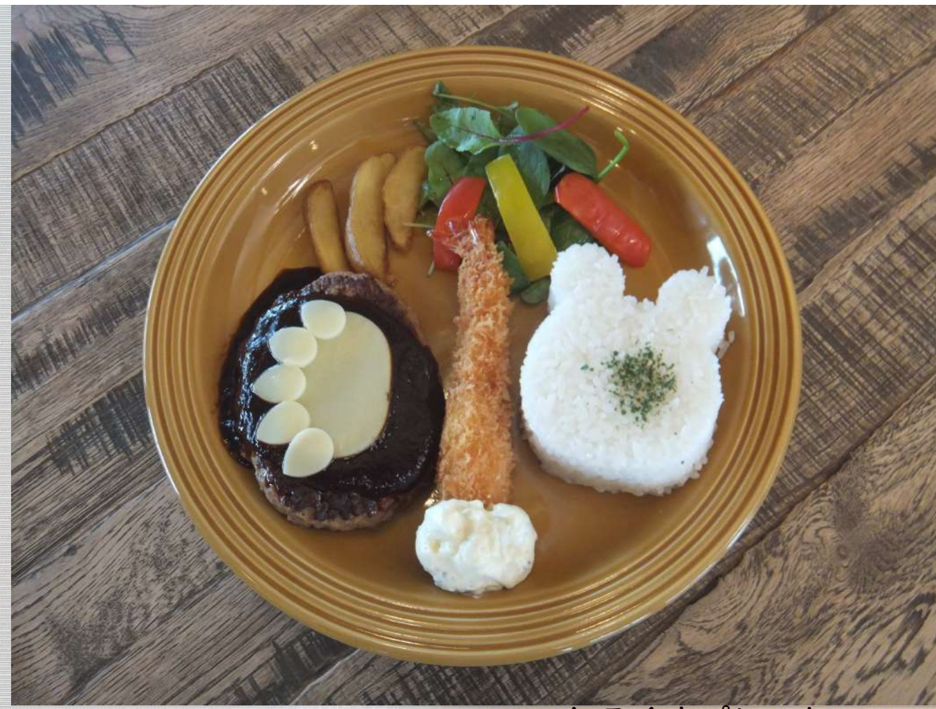
しろくまプレート