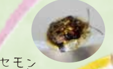
セモン ジンガサ ハムシ