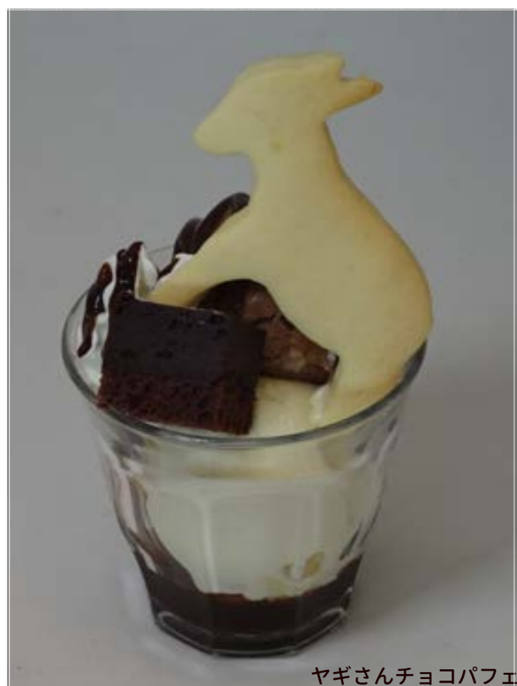
ヤギさんチョコパフェ