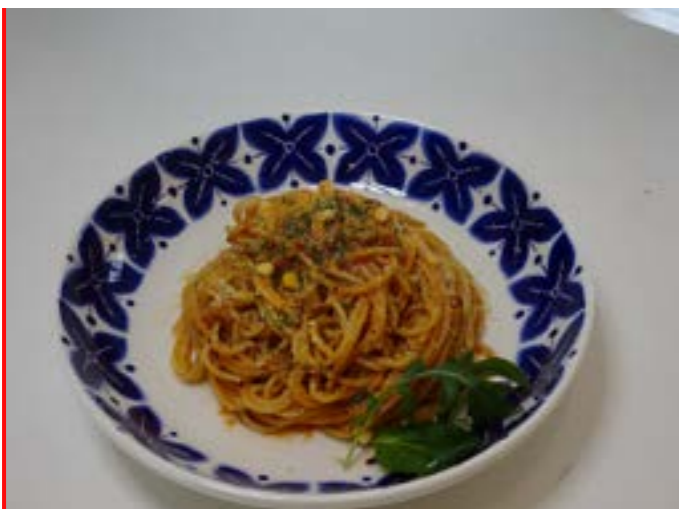
ボロネーゼパスタ