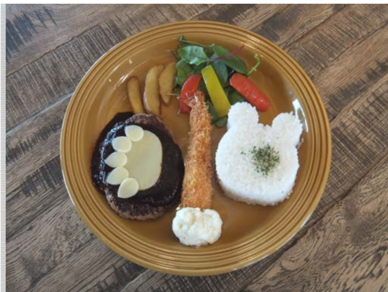
しろくまプレート