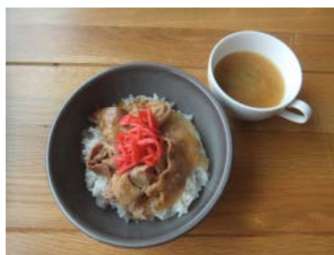
豚しょうが焼きボウル