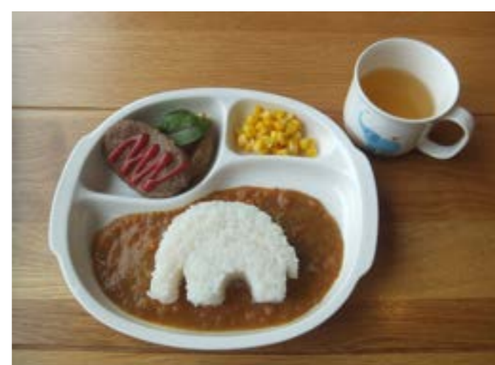
ハンバーグキッズカレー