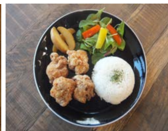
鶏の唐揚げランチ