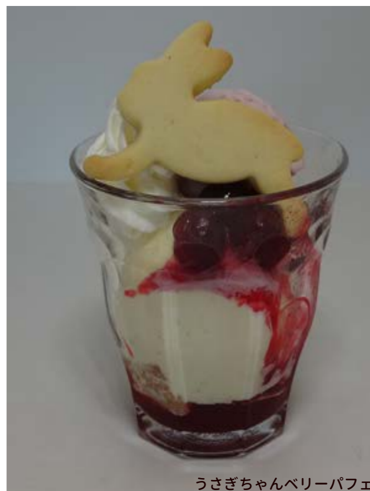
うさぎちゃんベリーパフェ